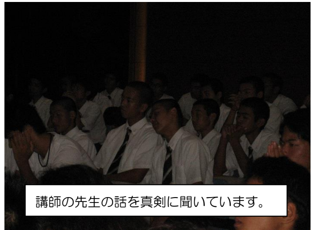
講師の先生の話真剣に聞いています。