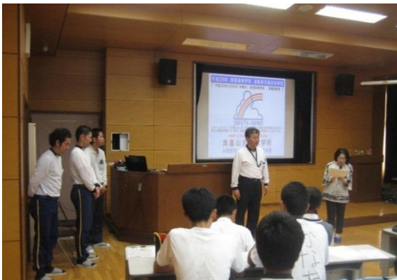
教頭先生から津嘉山自動車学校の講師の先生方の紹介