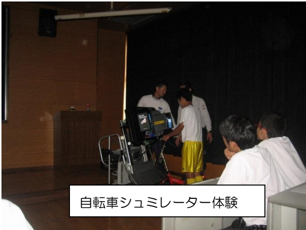
自転車シュミレーター体験