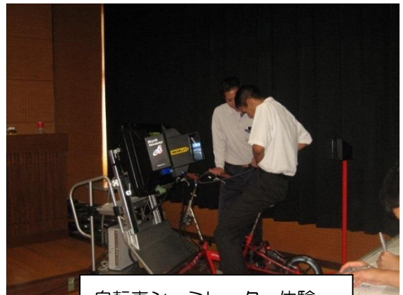
自転車シュミレーター体験