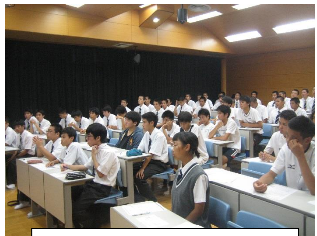
講師の先生の話真剣に聞いています。