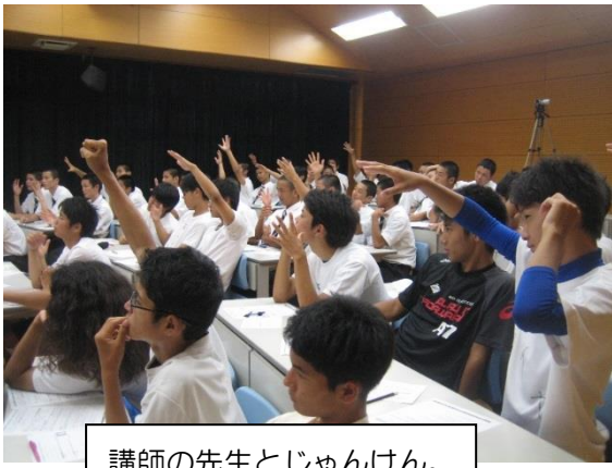
講師の先生とじゃんけん。