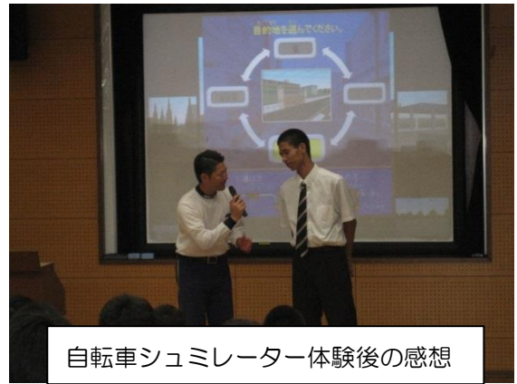
自転車シュミレーター体験後の感想