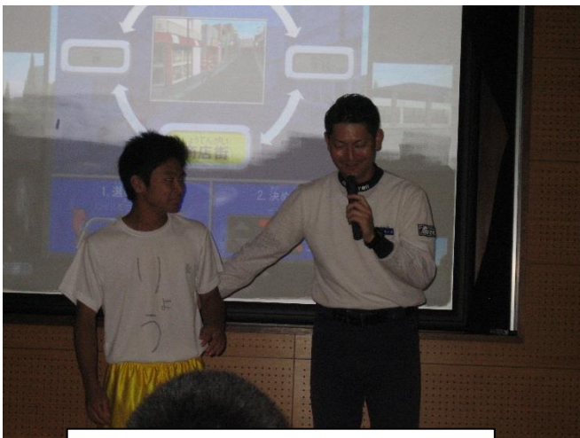
自転車シュミレーター体験後の感想